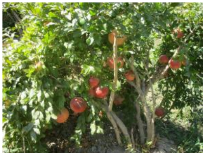
Анор тупига кўп танали шакл бериш (Хоразм вил., Хонқа тум.)