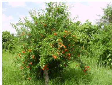
Анор тупига битта танали шакл бериш (Қорақалпоғистон Респ., Тўртқўл тум.)