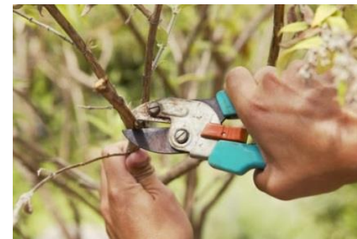
Анор новдаларини буташ жараёни