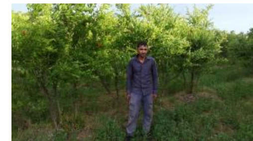
Анор тупларига уч танали усулда шакл бериш (Сурхондарё вил., Сарисийё тум., Дашнобод қиш.)

Анор тупларига тўғри шакл бериш уларнинг ҳосилга киришини тезлаштиради, ҳосилдорлигини юқори даражага етказишда ҳамда боғ қатор ораларига механизация ёрдамида ишлов беришга имкон яратади.