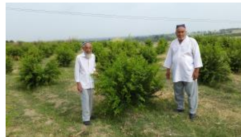
Анор тупларига совуқ ургандан сўнг шакл бериш (Фаргона вил., Қува тум., Мустақиллик шаҳ.)