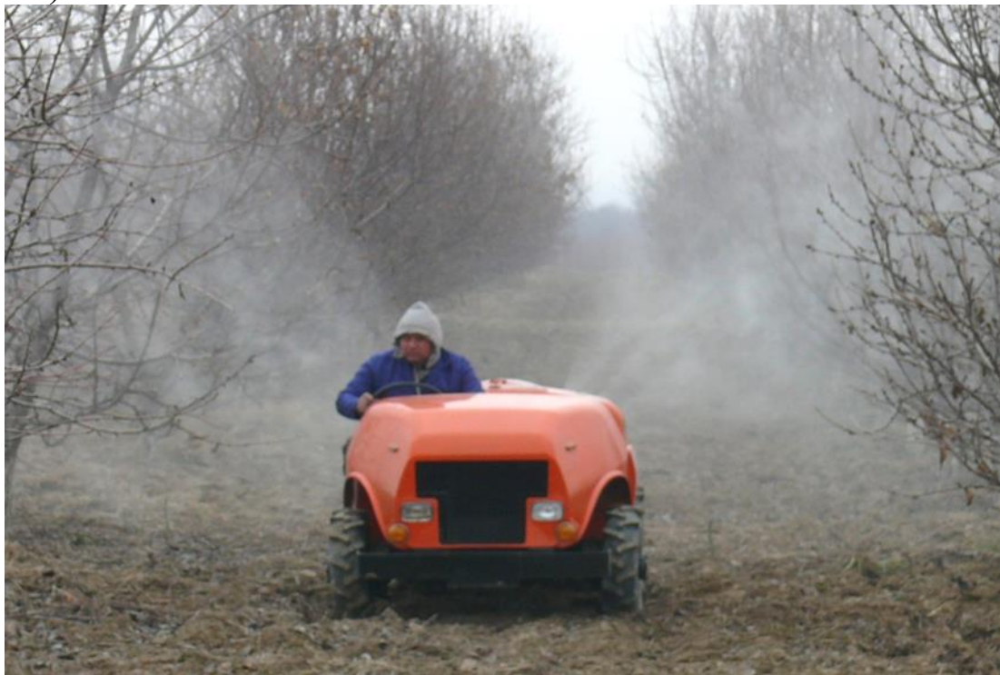
7-расм. (боғларга кимёвий ишлов бериш жараёни)

-Дарахтларни бутаб шакл берилгандан кейин ҳаво ҳарорати 5 С дан юқори бўлганда дарахтлар куртак ёзишдан олдин касалликларга қарши оҳак-олтингугурт қайнатмаси 5 С 0 градусли, темир купороси 53 фоизли кукин 2-3 %ли, 3% ли Бордо суюқлиги ( 100л сувга 3 кг мис купороси ва 3 кг сўндирилган оҳак) сепиш (7-расм).