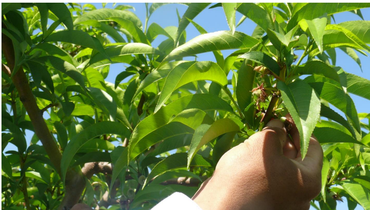
15-расм. (шафтоли мевасини 1-босқич тоқалаш жараёни)

Мевалидарахтлардатоқалаштадбириўтказилганда меваларни умумий сони камайиб, сувваозикланишрежмларияхшиланади. Натижада мевалар йирик, рангдор, маззали, товарлик даражаси юқори бўлган ҳосил олинади. Шу билан бирга дарахтнинг умумий ҳолатига ҳам ижобий таъсир кўрсатади (15-расм).