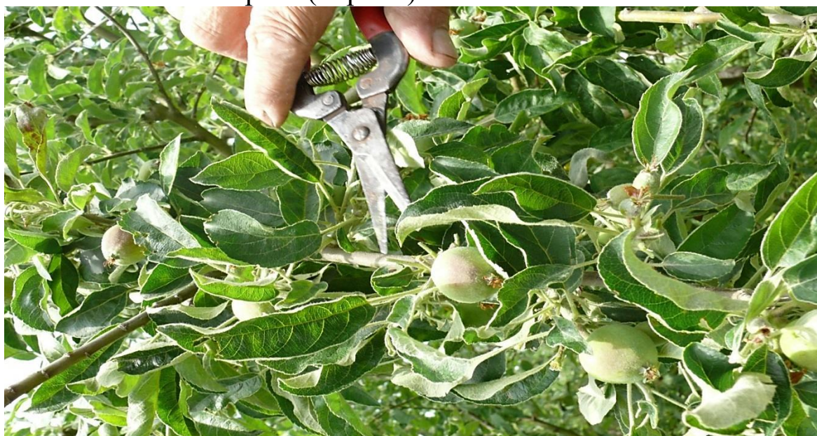
20-расм. ( Олма мевасини тоқалаш жараёни )

-Уруғли боғларда биринчи тоқалаш, данакли боғларда иккинчи тоқалашни амалга ошириш (20расм).