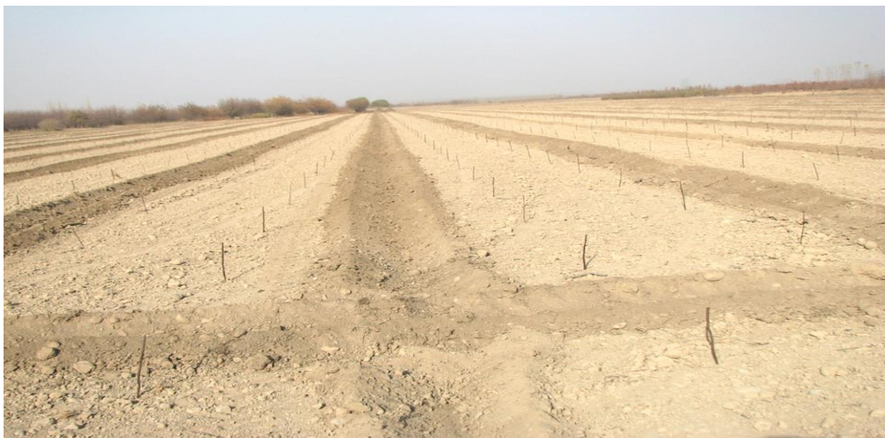
12-расм. (боғларга квадрат усулда режа тортиш)

-Кузда экилган боғларни назоратдан ўтказиш, хатоларни тўлдириш.