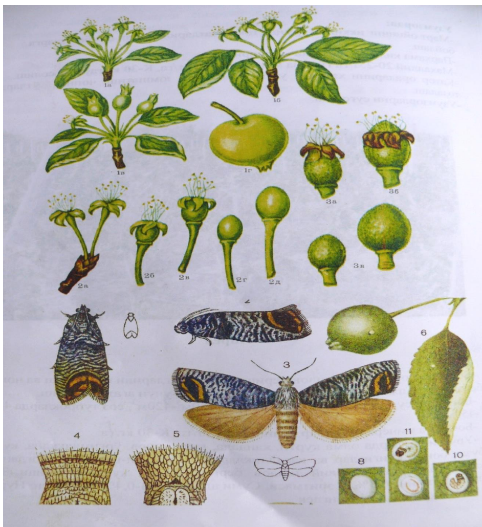
14-расм. (олма қурти капалаги)

-Боғларда олма қурти, қандала, кана, шира, ўргимчаккана, куялар, бузоқ боши, кўнғизларга (14-расм) қаршикимёвий ишлов бериш: Ламдок (0.4-0.8 л/га), Барлей (0.25 л/га), Суперметрин (0.8 л/га) каби перепаратлар сепилади.