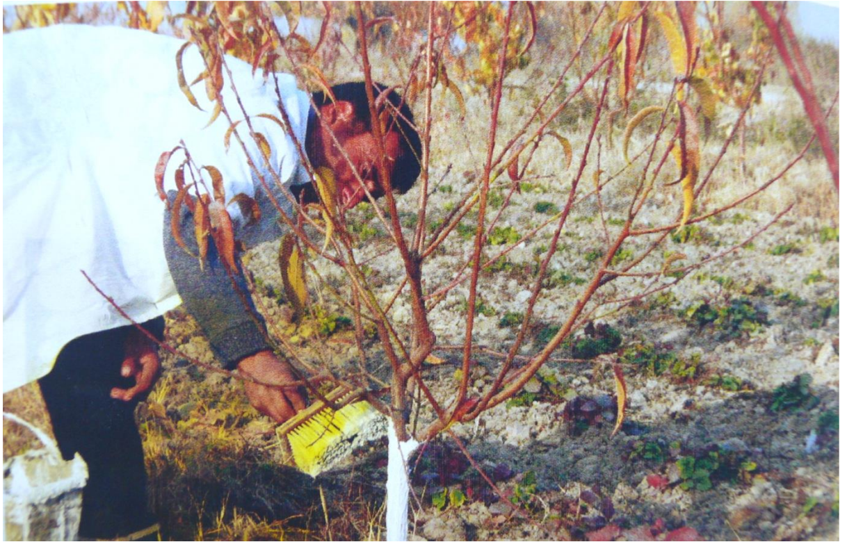
38-расм. (мевали дарахтларни охлаш)

-Тиргакларни йиғиштириш, фумигация қилиш ва уларни таклаб кўйиш.