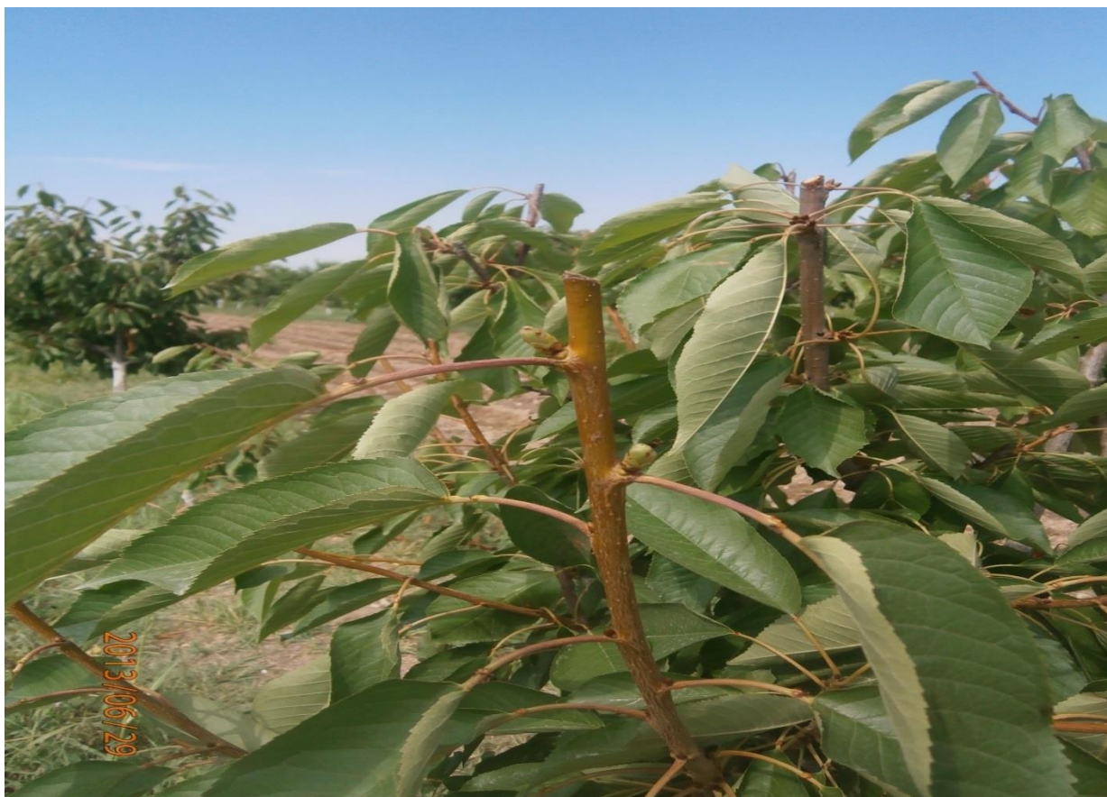
19-расм. ( ёзги кесиш )

мумкин. Бунда баҳорги кесиш вақтигача кутиб туриш шарт бўлмайди(19-расм).