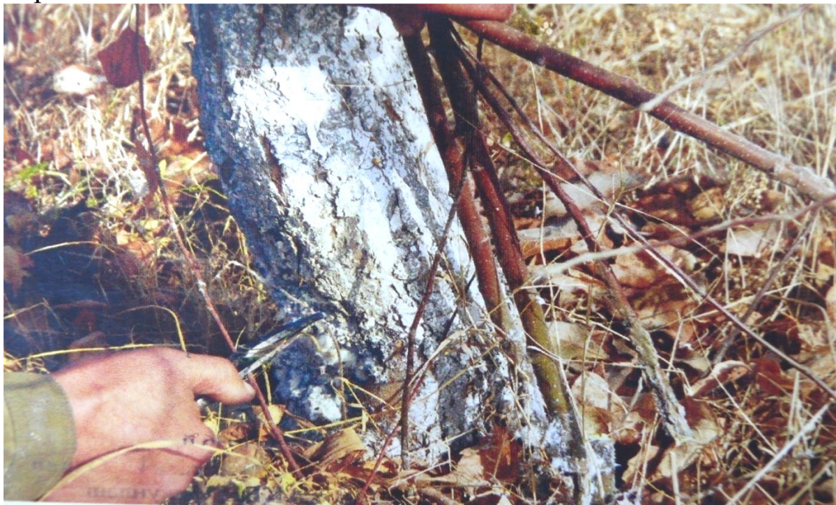
39-расм. (мева дарахти илдиз бўғзидан чиққан новдаларни кесши)

-Хаво харорати 5 С 0 дан юқори бўлганда уруғли мевали дарахтларига –олма, нок ва беҳининг синган шох-шаббаларидан, пўстлоқларидаги зараркунанда тухумларидан тозалаш, дарахтларни қирқиш ва уларга шакл бериш, қари дарахтларни ёшартириш, қуриган дарахтларни кўчириш каби ишларни олиб бориш.