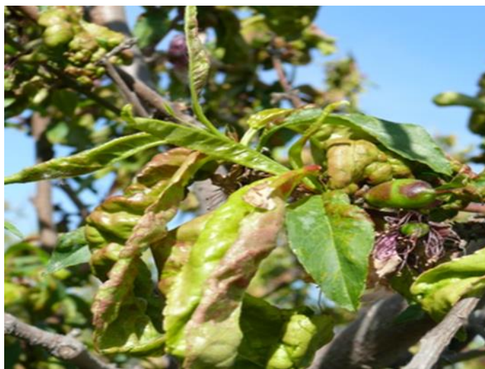
10-расм. (шафтолининг барг бужмалоги касаллиги)

Новдалар яланғоч бўлиб қолади ва шафтолига катта зарар етказди: дарахтлар зарарланган йили барглар ва мевалар қуриydi ва тўкилади, бир йиллик новдалар нобуд бўлади, кейинги йили дарахтлар тугунчаларини тўкади ва ҳосил бермайди. Суринкасига бир неча йил давомида кучли зарарланган дарахтлар нобуд бўлиши мумкин..